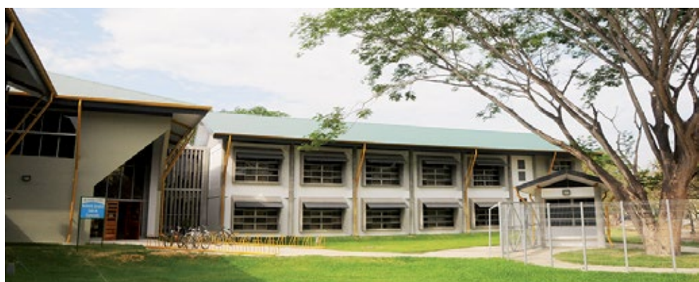
La UCR ha hecho considerables inversiones en la edificación de nuevas residencias estudiantiles, como es el caso de esta ubicada en la Sede de Guanacaste.

Por esas razones, la inversión que la UCR realiza en becas y beneficios complementarios para sus estudiantes, gracias a los recursos que otorga el Estado a través del Fondo Especial para la Educación Superior (FEES), hace de nuestra institución una universidad pública cada día más inclusiva, generosa y solidaria, especialmente con las poblaciones económicamente menos favorecidas.