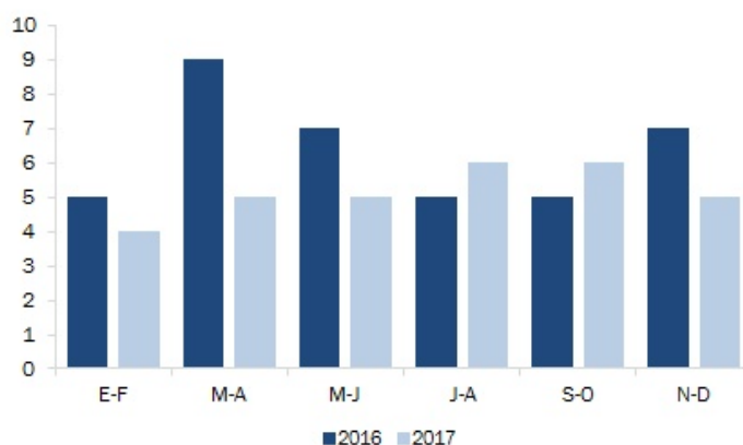
Gráfico 2 Sesiones de debate, por mes. 2016 y 2017