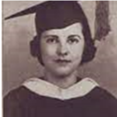
Imagen Revista Costarricense N°510