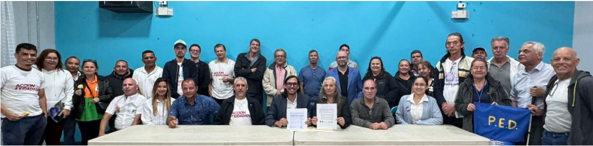
Representantes de partidos políticos y fuerzas vivas firmaron el Pacto Ético Ambiental de Desamparados.

Representantes de diversas corrientes políticas comprometidos con la preservación y mejora del medio ambiente, se reunieron la noche del jueves 1 de febrero en el Salón Comunal de San Miguel de Desamparados para comprometerse en un Pacto Ético Ambiental que guíe las acciones políticas y promueva acciones responsables con temas clave en Desamparados.